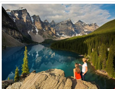
加拿大紙幣上的風景 - 夢蓮湖

早上前往機場轉機飛往亞伯達省第一大城 - 卡加利，此城兼具牛仔風味與現代都市風情，由於石油天然氣的開發，讓卡加利成為大草原上商業繁盛的水泥森林，是北美地區石油重鎮。沿著 1 號楓葉國道高速公路，行經一九八八年冬季奧林匹克運動公園後，慢慢進入無盡的曠野，遠方以洛磯山脈為背景的天際線漸入眼簾，不久抵達加拿大第一座國家公園 - 班夫國家公園。午後，前往瑪麗蓮夢露拍攝電影“大江東去”的著名場景◎弓河瀑布，來到◎驚奇角遠眺弓河谷地及以群巒疊翠為背景的百年班夫溫泉城堡。並安排搭乘玻璃觀景★纜車，登上海拔高度2281公尺的硫磺山，居高臨下，不但可以一覽班夫全景，還能環視四周雄偉群山，山頂常見到大角羊等野生動物。晚餐後，您可自由前往班夫大道上的精品櫥窗一逛，體驗山中小城風情，今晚住宿班夫鎮上旅館。