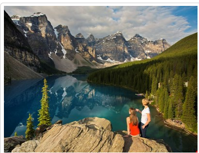
加拿大紙幣上的風景 - 夢蓮湖

*註:2026最新最夯的韓劇：<愛情怎麼翻譯>，劇中男女主角周浩鎮（金宣虎飾）與車茂熙（高胤禎飾），以及另一位男主角黑澤博（福士蒼汰飾），在加拿大拍攝戀愛實境節目《浪漫之旅》的片段，就是在班夫鎮上取景的呢，這麼唯美浪費的地方您絕不能錯過