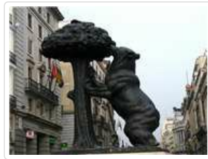
馬德里熊抱樹市標