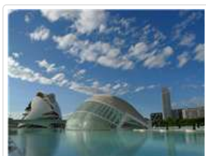
瓦倫西亞 藝術科學城