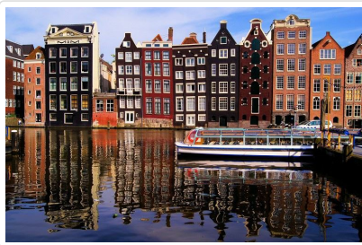
玻璃船悠遊運河水道

早餐後前往阿姆斯特丹北邊郊區往著名的◎ 風車村 。此處就像一間露天博物館，鮮綠的木造房屋、明亮的窗台搭配白色窗簾、紅磚小屋與穿著傳統服裝的農夫，完整呈現17~18世紀荷蘭人的生活，尤其是荷蘭著名的乳酪及木鞋製作過程，令人留下深刻的印象。阿姆斯特丹北邊郊區的北海小漁村—◎ 沃倫丹 ，可愛的濱海木造房屋、明亮的窗台搭配白色簾紅磚小與穿著傳統服裝的農夫，都是拍照焦點。安排搭乘★ 玻璃船 悠遊於大小運河水道，飽覽市區多樣化建築景色。另以「鑽石之都」聞名的阿姆斯特丹，閃爍的◎ 鑽石切割與展示 ，更是不可錯過！晚餐享用米其林推薦餐廳主廚精選風味餐。