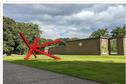
庫勒慕勒美術館入內

早餐後拜訪有『梵谷森林』美譽，亦為荷蘭境內最大的★HOGE VELUWE梵谷國家公園，樹蔭林立的綠色森林內，樺樹、松樹、橡樹遍佈，公園內更提供免費的自行車騎乘，可在此享受一個荷蘭式的悠閒午後。並參觀公園內之★庫勒慕勒美術館，欣賞印象派梵谷繪畫，狂放不羈、熱情洋溢的畫作，滿足您欣賞藝術的渴望，館內收集了近三百件梵谷之作品，鎮館之寶—梵谷“星空下的咖啡座”即收藏於此，同時也珍藏許多世界知名藝術家，例如畢卡索、秀拉、蒙德里安等。在自然公園內建立美術館，象徵著自然、藝術與建築的結合、天氣好時窗明几淨、彷彿置身世外桃源。之後返回阿姆斯特丹市區，佇足市區安排搭乘★玻璃船悠遊於大小運河水道，飽覽市區多樣化建築景色。以鑽石之都聞名的阿姆斯特丹，其精彩的◎鑽石切割表演及展示，您更是不可錯過。前往著名的◎水壩廣場：12世紀時此地居民在阿姆斯特河上建造了一個小水壩(DAM)並聚集定居，後漸發展為城市，阿姆斯特丹市名因此而來。原水壩的位置就是現在的水壩廣場，位於市中心黃金位置又擁有醒目的建築物和頻繁的活動而著名，一旁的◎舊王宮：原為17世紀荷蘭黃金時代為了彰顯城市繁榮所建的市政廳，後因路易·拿破崙擔任荷蘭國王時指定為國王住所而改建得美輪美奐。其最大特色為使用13659根木材打樁，使建築物不會下沉，為當時的建築奇蹟。