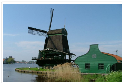
露天博物館—風車村