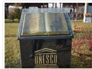
番紅花城世界文化遺產 (1994年)