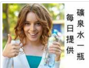
每日提供礦泉水一瓶

【鄂圖曼風格】鄂圖曼風格為兩到三層木造結構的建築，上面樓層突出於下層，並有雕刻的支架作為支撐。房屋用木材框架作為基礎再填充土磚，最後塗上灰泥以及稻草的混合物，外牆刷上灰泥或石灰再用木頭裝飾，內部大約有10-12間房間。