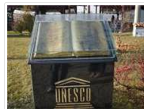
番紅花城世界文化遺產 (1994年)