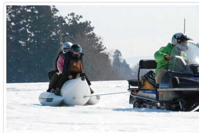
飯豐町雪之樂園戲雪