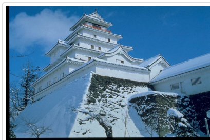
會津若松城(鶴之城)