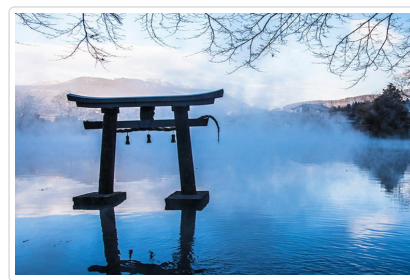
金鱗湖(晨霧和出泉之鄉)

🍴 餐食 早餐:飯店內用 午餐:豐後牛料理(不吃牛可改)¥2500-3000 晚餐:飯店內會席料理或自助餐