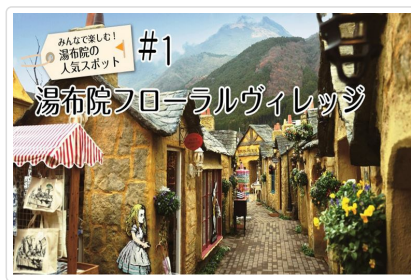
湯布院(湯之坪街道散策)