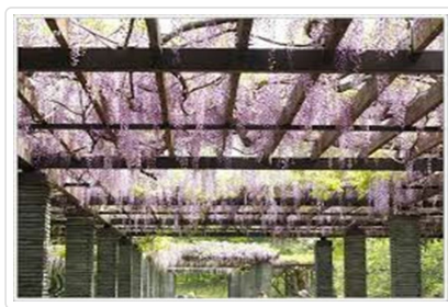
舞鶴公園(紫藤名所)

行程交通住宿及旅遊點儘量忠於原行程,有時會因賞花人潮及飯店確認關係,行程前後更動或互換觀光點或住宿地區順序調整,如遇特殊情況如船、交通阻塞、觀光點休假、住宿飯店調整或其它不可抗拒之現象,行程安排以當地為主,情非得已,懇請諒解。並請於報名時特別留意。