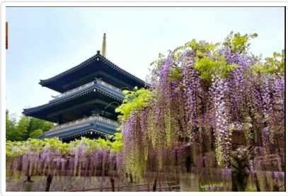
吉祥寺公園 (紫藤名所)

行程交通住宿及旅遊點儘量忠於原行程，有時會因賞花人潮及飯店確認關係，行程前後更動或互換觀光點或住宿地區順序調整，如遇特殊情況如船、交通阻塞、觀光點休假、住宿飯店調整或其它不可抗拒之現象，行程安排以當地為主，情非得已，懇請諒解。並請於報名時特別留意。