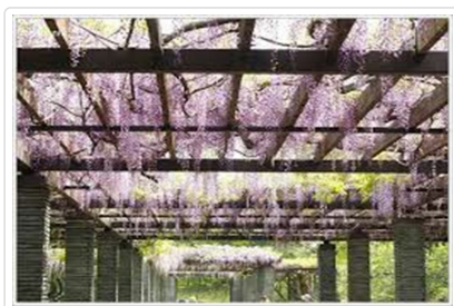
舞鶴公園(紫藤名所)

行程交通住宿及旅遊點儘量忠於原行程,有時會因賞花人潮及飯店確認關係,行程前後更動或互換觀光點或住宿地區順序調整,如遇特殊情況如船、交通阻塞、觀光點休假、住宿飯店調整或其它不可抗拒之現象,行程安排以當地為主,情非得已,懇請諒解。並請於報名時特別留意。