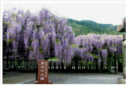
素盞鳴神社(紫藤名所)

行程交通住宿及旅遊點儘量忠於原行程，有時會因賞花人潮及飯店確認關係，行程前後更動或互換觀光點或住宿地區順序調整，如遇特殊情況如船、交通阻塞、觀光點休假、住宿飯店調整或其它不可抗拒之現象，行程安排以當地為主，情非得已，懇請諒解。並請於報名時特別留意。