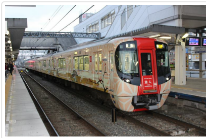
特別安排搭乘：旅人開運電車