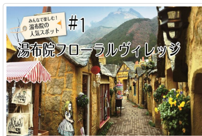
湯布院(湯之坪街道散策)