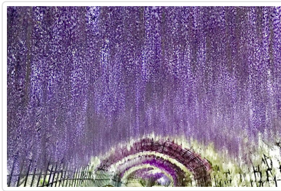
河內藤園 (最美十大林蔭隧道)