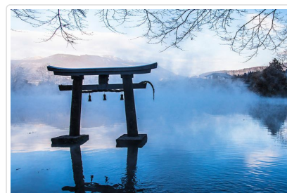
金鱗湖(晨霧和出泉之鄉)

🍴 餐食 早餐:飯店內用 午餐:豐後牛料理(不吃牛可改)¥2500-3000 晚餐:飯店內會席料理或自助餐