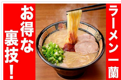
九州名物（一蘭拉麵）