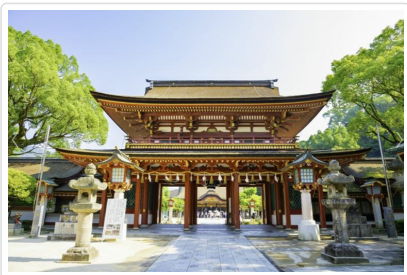
太宰府天滿宮 (學問之神)

【一蘭拉麵】源自於日本博多，麵條使用細麵，屬於九州豚骨拉麵。1960年創業於福岡市，早期是會員制度，直到1994年才開放對外營業，時至今日仍為豚骨拉麵的代表店家，獨特的湯頭與彈牙的拉麵，讓您別有一番風味體驗，不竟讚不絕口直嘆 - 這才是真正的日本拉麵呀！