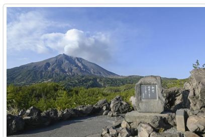
櫻島有村熔岩展望台