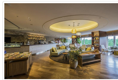
鳳凰喜凱亞度假村

🍴 餐食 早餐：飯店內用 午餐：古民宅內日式御膳料理 晚餐：溫泉會席料理或迎賓自助餐