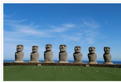
日南太陽花園摩埃像