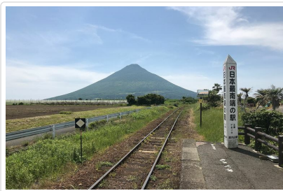
JR日本最南端的無人車站

能眺望錦江灣和櫻島的霧島溫泉鄉誕生新住宿設施！座落在山谷包圍能眺望錦江灣和櫻島的霧島溫泉鄉頭等地的度假型溫泉飯店，以南歐風為設計的客房陽台，是LA VISTA系列中創先鋒的全客房皆為露天浴室（觀景浴盆），採用自山麓湧出的霧島溫泉，用溫泉洗滌掉身上的疲憊與辛勞並可觀望櫻島和霧島山、飯店內的花園泳池、庭園等等。