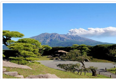
仙巖園（又稱磯庭園）

坐落在眼下展現著鹿兒島街景、海拔108米的高地“城山”上，享有可觀望鹿兒島的象徵—櫻島及錦江灣美景的溫泉旅館。享用富有鹿兒島特色的美食；浸泡在從地下1,000米處抽取的溫泉中，觀望櫻島及市街美景的“觀景露天溫泉”等，可提供任何年齡層的客人都能在櫻島美景及綠蔭環繞的大自然中盡享美好時光。