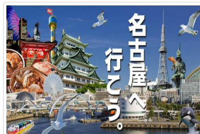
自由體驗榮町夜生活

🍽️ 餐食 早餐:溫暖的家 午餐:壽司便當+茶飲1只 或退現金¥1,000(高速公路站自由食) 晚餐:溫泉旅館內會席料理或自助餐