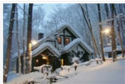
富良野森林精靈的陽台