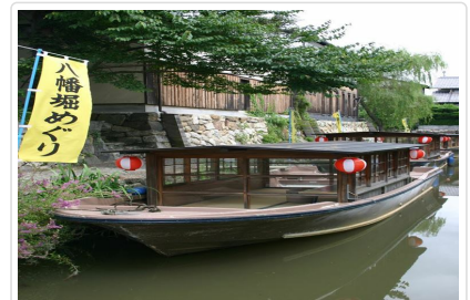
八幡堀水鄉觀光船

🍴 餐食 早餐：飯店內用 午餐：近江牛壽喜鍋料理 晚餐：旬日式創作料理或燒烤料理或涮涮鍋