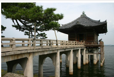
近江八景之一浮御堂