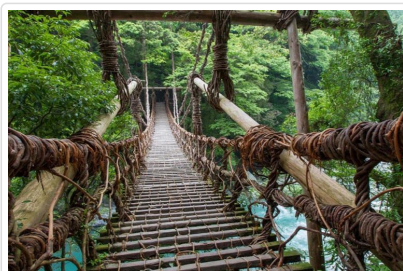
日本三奇橋～祖谷葛藤橋