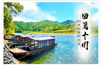
最後的清流～四萬十川

🍴 餐食 早餐：飯店內用 午餐：屋形船四萬十川旬味御膳 晚餐：飯店內總匯自助餐 或 飯店內會席料理 或 愛媛御膳料理