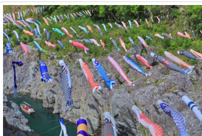
大小步危峽谷遊覽船

是讓高知縣民與觀光客都能享用佳餚的美食聖地，位於高知城旁，從高知鄉土料理炙燒鯉魚以及匯集了屋台餃子、土佐和牛、拉麵...等四國特色美食應有盡有。在充滿懷舊氣氛的市場內，聚集了攤販形式的餐飲商家、充滿氣勢的鮮魚商與鮮肉商、獨特別緻的雜貨店與服飾店等65家店鋪。