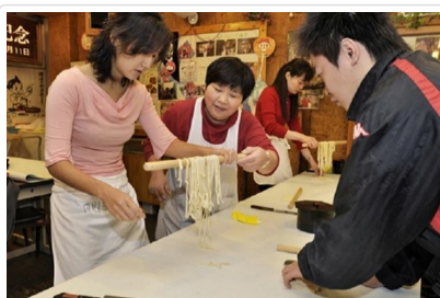
讚岐烏龍麵手作體驗

座落在標高521公尺的象頭山腳下，境內供奉的是大物主神和崇德天皇，自古以來就以保佑海上安全、五穀豐收等聞名，因此許多造船廠在新船下水前會先來祈求平安。金刀比羅宮最著名的就是參道總計有1368階石階，儘管參拜需要些體力，但每年還是吸引超過400萬人前來參拜，是全國知名的能量聖地，也是自古以來許多日本人心目中「一生一定要去朝聖一次」的重量級景點。