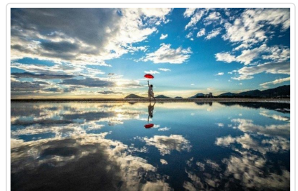
天空之鏡～父母之濱海岸

🍴 餐食 早餐：飯店內用 午餐：香川名物～讚岐烏龍麵御膳料理 ¥3000 晚餐：飯店內總匯自助料理 或 飯店會席料理 或 日式涮涮鍋 吃到飽