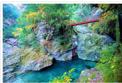
中津溪谷福氣秘境散策

【四萬十川】位於日本高知縣西部渡川水系的幹流，全長196公里、流域面積2270平方公里。是四國第二大河。該河幹流未建設任何大型水庫，而有「日本最後的清流」之稱，並與柿田川和長良川並稱為日本三大清流。名水百選、日本秘境100選之一。全年可見四季的不同風景，已入選重要文化景觀。由於繞山間而行，迂迴曲折的河道特色不利於建設開發，且未興建任何大型水庫阻斷主流的水流，因此得以保留河川原始的自然面貌，群山與潺湲的河川交織出日本最原始的自然風光，正是四萬十川屹立不搖的魅力所在。