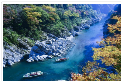
大小步危峽谷遊覽船