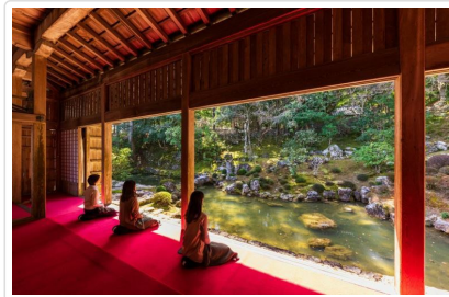
令人驚喜的靜謐竹林寺