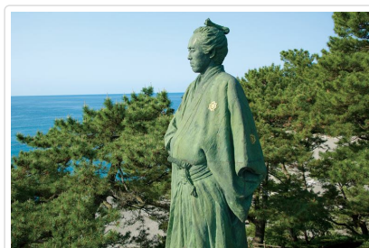
？本龍馬：來自高知的日本革新者

【塩江温泉鄉】位於香川縣中部，高松市最南端，據傳約1300年前的奈良時代初期，由著名的行基和尚發現的。之後弘法大師也在這片區域修行，向大家推薦了溫泉療法，據說造成當時村子人山人海的景象。