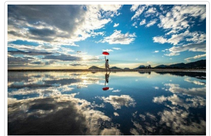
天空之鏡～父母之濱海岸

🍴 餐食 早餐：飯店內用 午餐：香川名物～讚岐烏龍麵御膳料理 ¥3000 晚餐：飯店內總匯自助料理 或 飯店會席料理 或 日式涮涮鍋 吃到飽