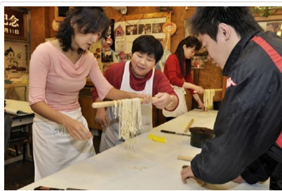
讚岐烏龍麵手作體驗

座落在標高521公尺的象頭山腳下，境內供奉的是大物主神和崇德天皇，自古以來就以保佑海上安全、五穀豐收等聞名，因此許多造船廠在新船下水前會先來祈求平安。金刀比羅宮最著名的就是參道總計有1368階石階，儘管參拜需要些體力，但每年還是吸引超過400萬人前來參拜，是全國知名的能量聖地，也是自古以來許多日本人心目中「一生一定要去朝聖一次」的重量級景點。