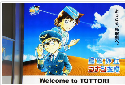
鳥取砂丘柯南空港