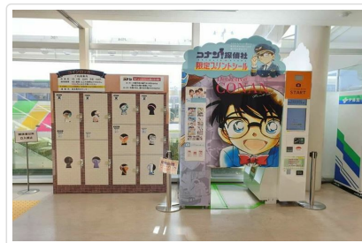
鳥取砂丘柯南空港