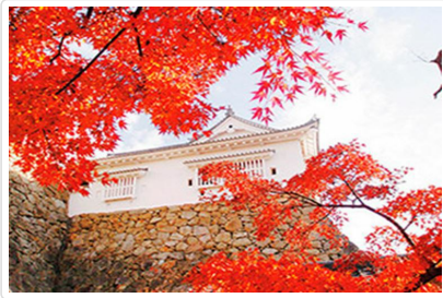
紅葉名所鶴山公園

園內的重大設施花迴廊：環繞一周約有1公里的距離，與通過地面25米的附帶屋頂的展望走廊相連接，不論季節和天氣在植物園全年都可以遊覽觀光。百合為主題花，全年展示。並且為日本唯一保有並展示全日本的野生百合品種15種的地方。「花之丘」是園內最佳的觀賞點，以雄偉的大山為背景綻放的花的風景真的是美不勝收，也是最受歡迎的攝影之地。