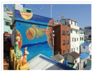
甘川洞彩繪文化村