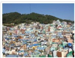
甘川洞彩繪文化村

◎【土產店】選購韓國著名泡菜及海苔等當地名產饋贈親友。 隨即前往機場，搭機返台結束愉快的韓國之旅。