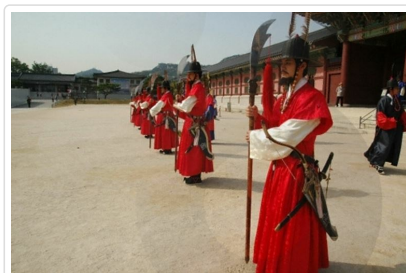
朝鮮時代傳統儀式