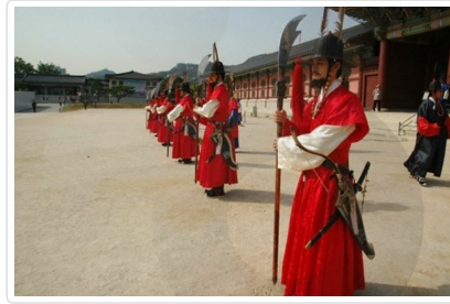
朝鮮時代傳統儀式