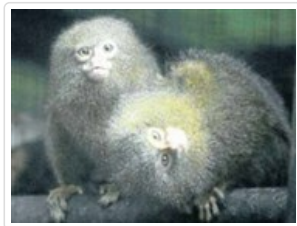
太平動物園(專業猿長類動物園)