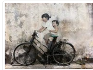
喬治城老街藝術壁畫街景

🍴 餐食 早餐：飯店早餐 午餐：Old Town 風味餐 (RM30) 晚餐：大牌檔每人發現金 (RM 20)