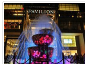
巴比倫廣場的琉璃噴水池