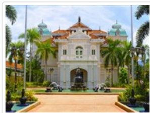
蘇丹阿斯蘭沙博物館