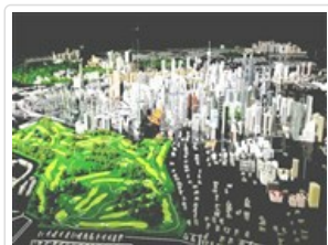
吉隆坡城市規劃展覽館