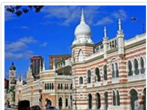
蘇丹阿都沙默大廈

城中城即吉隆坡代表現代時尚的KLCC(即吉隆坡市中心)~摩天大樓區，周邊約有40棟高樓，其中最受矚目的是◎《雙子星》高塔，安排至Simfoni 湖畔，這是拍攝《雙子星》高塔最佳地點，夜間的雙子星塔就像是明亮的蠟燭倒映在水中閃閃發光，煞是美麗；您亦可靠近塔基與雙峰塔合影。