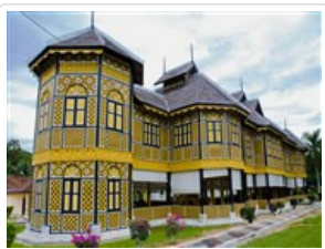
江沙皇城皇家博物館