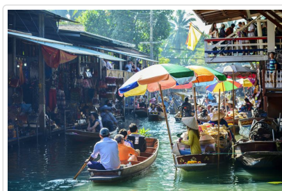
丹能沙朵水上市場