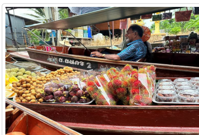
丹能沙朵水上市場

占地逛大，店家數量驚人，服飾、鞋款、飾品...等種類五花八門，因為是曼谷批發中心，各地服飾店家也會來此批貨，也接受一般零售，買單件也行，但買多即可享批貨價。