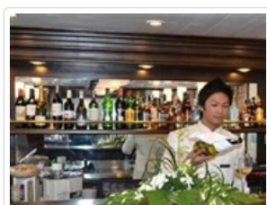
下龍灣準備晨間早茶