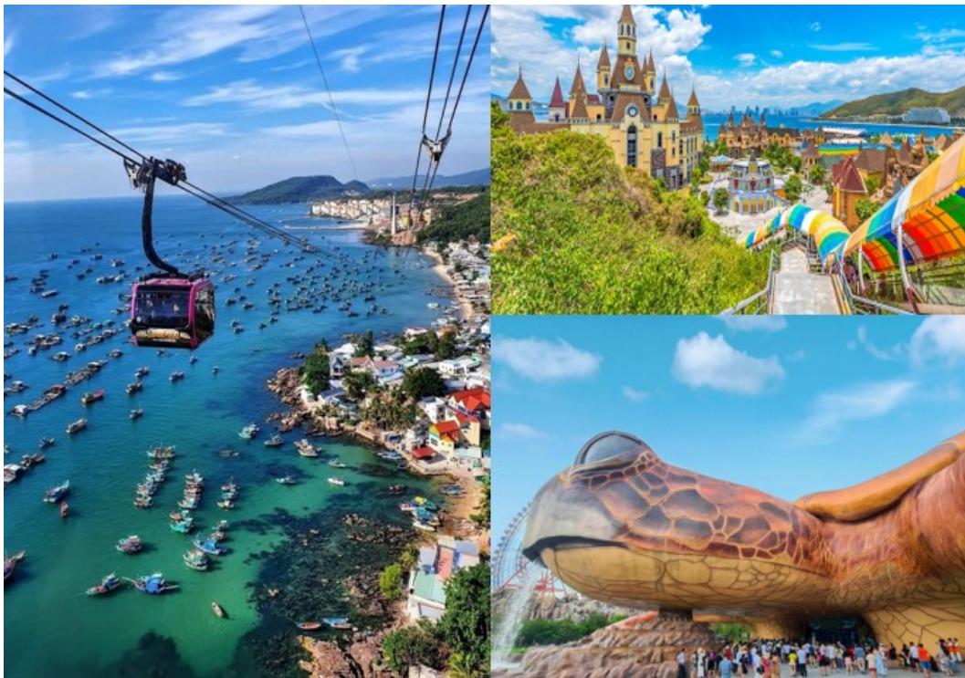
盡享海濱風情~富國島(Phu Quoc)

「富國島(Phu Quoc)」位於越南西南側的暹羅灣上，呈南北狹長形，約有2個台北市那麼大，島民卻只有10萬人而已。四季如夏的富國島，白天溫度約30°C，東、西兩岸都有綿長的沙灘，東岸的「Sol Beach (星海海灘)」皆為白沙，可以稱得上是祕境中的「祕密花園」，這裡較其他海島景點而言，遊客較為稀少，擁擠與嘈雜彷彿根本不存在，相對地環境汙染與破壞也少。踩起來如麵粉般的粉質白沙，細緻鬆軟，伴隨海濤的波浪拍打聲，有種踩在雲端的飄飄然。富國島最大的魅力在於其清靜的氛圍，即使是頗富盛名的"長灘"，有時也少有遊客，這裡可以靜靜坐在沙灘上觀賞日出日落，或是隨意散步，這種可以隨性自然，遠離塵囂的氛圍就是富國島的趣味。