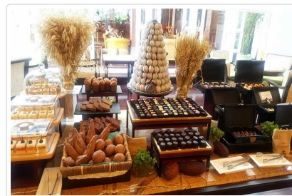
Metropole Chocolate Buffet

🍴 餐食 早餐：飯店內享用 午餐：達人私藏 美味道地越南河粉 含飲料 晚餐：米其林二星主廚PRESS Club四道式創意西式料理(含可樂或當地啤酒或果汁一杯)