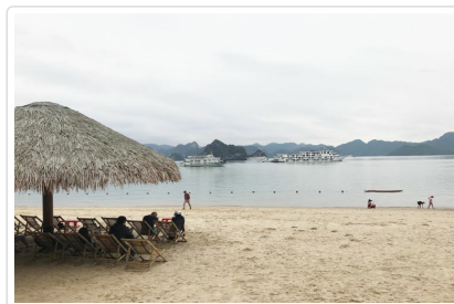
Soi Sim Island