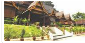
馬六甲蘇丹國宮殿