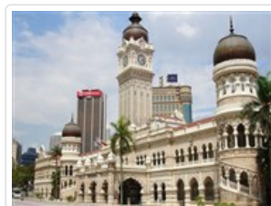
蘇丹阿都沙默大廈