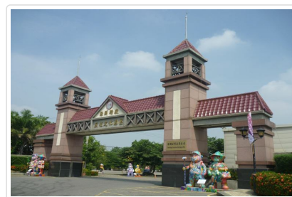
蒜頭糖廠蔗埕文化園區

🍴 餐食 早餐：飯店早餐 午餐：山產美食—竹香園甕缸雞合菜 / 7人一桌 晚餐：飯店內自助晚餐