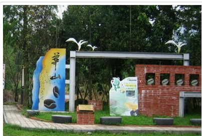
雲林古坑華山咖啡園區

今晚安排入住— 長榮文苑酒店 : 2020年4月嘉義新開幕的五星飯店Evergreen Palace Hotel Chiayi。位於嘉義故宮南院旁, 豪華舒適放鬆的氛圍, 體貼的服務, 超棒的房間住宿, 再加上親子設施、娛樂室、游泳池, 可是來嘉義旅遊的渡假好選擇唷。