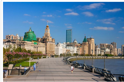
外灘萬國建築博覽群