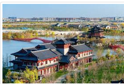
大洋灣生態旅遊景區