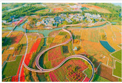
三台山國家森林公園

◎ 鳳城夜景 :華燈初上之際,鳳城河兩岸燈火璀璨,古橋、亭台倒映水面,望海樓在燈光的映襯下更加恢宏奪目,老街滿是大紅燈籠,熱鬧非凡。古老的街巷與現代的燈光交織,呈現出獨特的風情。您可以感受這座水城夜晚的靜謐與活力,沿著水岸線,欣賞迷人的夜景,在流光溢彩中,為這充滿自然詩意的一天畫上完美的句點。