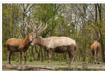
大豐麋鹿國家自然保護區