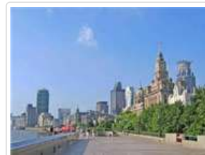
黃埔江遊輪遊上海灘