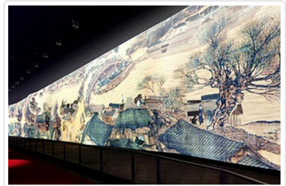
電子版清明上河圖