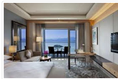
千島湖喜來登渡假酒湖景房

貼心規劃 千島湖遊船都是許多團共搭一艘船，然而交通狀況因素，每團抵達碼頭時間不一，先到者需等候其他團到齊才開船，上島參觀亦是如此。我們採用包船，鳳凰的團上船後隨即開船，自己一艘船，輕鬆自在遊覽千島湖美景。