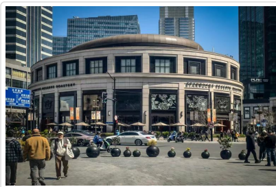
星巴克臻選烘焙工坊

活態度。隨後參觀位於上海南京西路興業太古匯的◎The Louis 路易號(外觀打卡)，是一座全球獨一無二的巨型郵輪造型品牌展覽裝置，迅速成為城市熱門打卡新地標。◎南京路步行街位於上海市黃浦區，是上海最著名的購物街之一，有著「中華商業第一街」的美譽，東起外灘，西至西藏中路。步行街集購物、美食、文化展示於一體，既有永安、先施等老字號商店，也有眾多現代化商場。傍晚登上遊船★船遊黃浦江+外灘夜景，當遊船緩緩駛過，兩岸外灘萬國建築群與陸家嘴的璀璨摩天大樓交相輝映，燈火輝煌，盡顯上海的摩登與繁華，感受東方明珠的無限魅力。