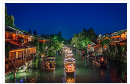
小搖櫓船夜遊烏鎮夜景