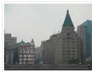
外灘萬國建築博覽群