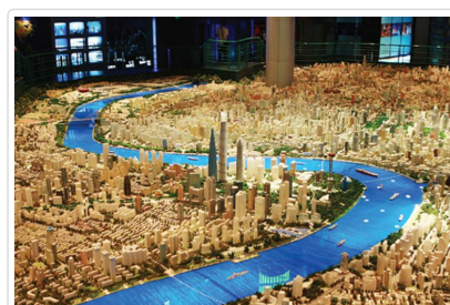
上海城市規劃展示館

🍴 餐食 早餐：飯店內 午餐：棗子樹素食合菜100 晚餐：台灣人道素菜(蓮香齋多國料理自助餐)198