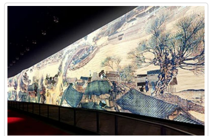
電子版清明上河圖