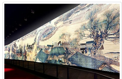
電子版清明上河圖