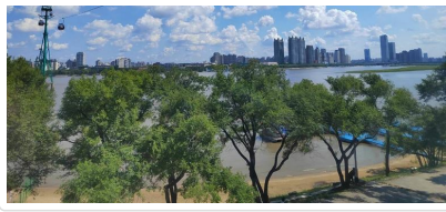
搭纜車 欣賞松花江