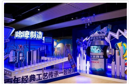
哈爾濱啤酒博物館