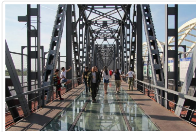
百年濱洲鐵路橋 玻璃棧道