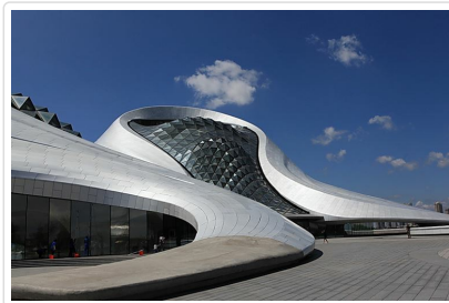
外觀 哈爾濱大劇院