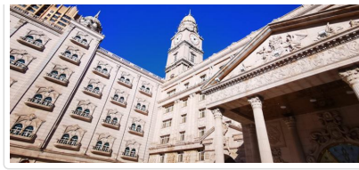
哈爾濱 東北羅浮宮 哈藥六廠