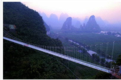
荔江灣翔龍玻璃橋