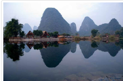
早餐前在此散步十分鐘