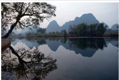
河畔酒店後院步道風景

答：因陽朔最美麗的遇龍河，風景最美而且可以蓋酒店的位置已經被河畔渡假酒店佔據了，依山傍水，地理位置獨一無二，就好比金鳳凰江南行程上海用的和平飯店，位於上海最美的外灘，其他酒店無法比擬。