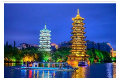
夜船遊四湖 日月雙塔

特殊安排 夜船遊四湖安排★專屬包船，免去與其他團體共乘的喧擾，搭配★茶點，讓您在航程中邊品茶點邊賞景，細細品味桂林的夜之美。