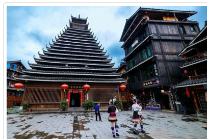
程陽八寨 侗族鼓樓

行車距離 桂林 - 程陽八寨景區 車程約2小時 / 程陽八寨景區 - 三江 車程約30分鐘