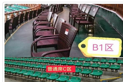
劉三姐B1席(圖上)一般席(圖下)

特殊安排 灘江遊船特別指定第二層座位，視野極佳，是拍攝山水美景和感受船在江中走，人在畫中游的絕佳位置。