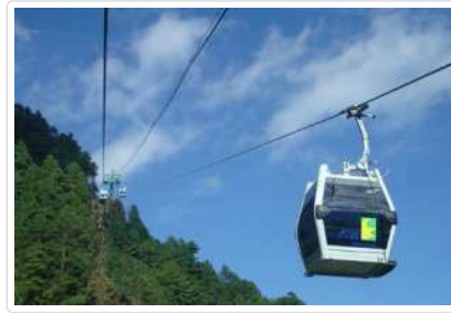
蒼山洗馬潭大索道