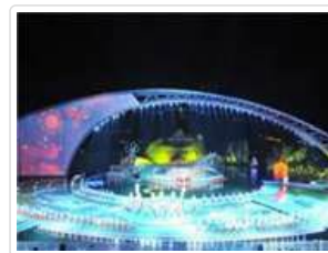
希夷之大理--望夫雲